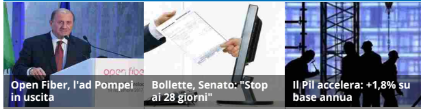
Open Fiber, l'ad Pompei